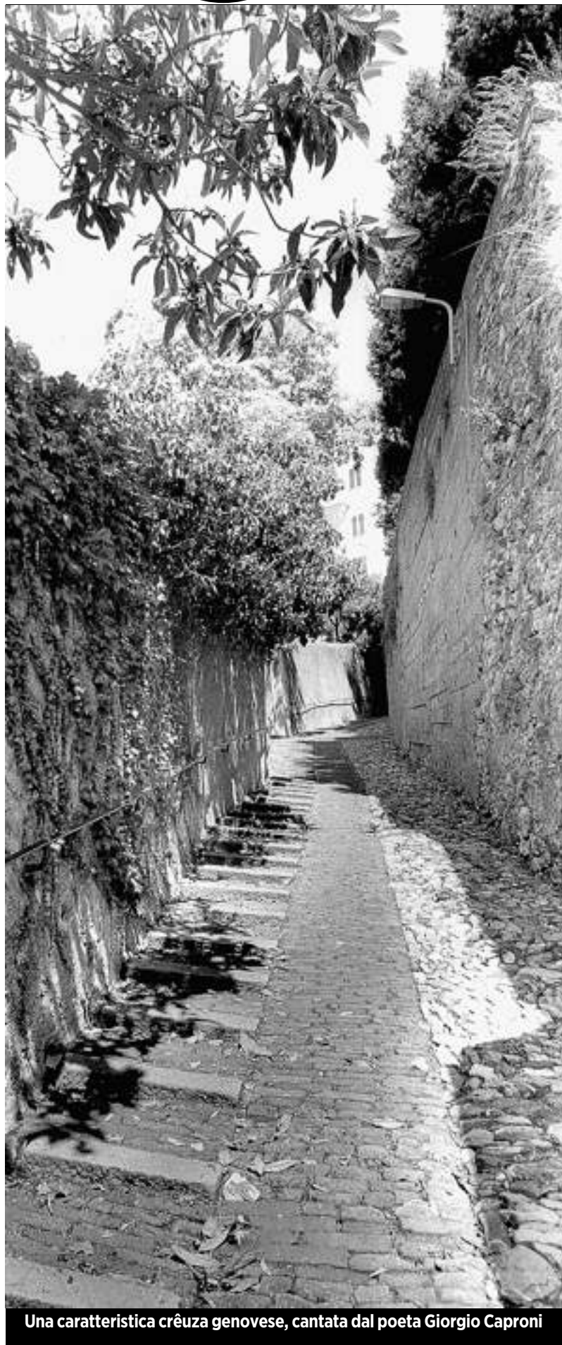
Una caratteristica crúza genovese, cantata dal poeta Giorgio Caproni

Di Caproni l'anno prossimo sono venti anni dalla morte e nel 2012 il centenario, solo un augurio che Genova e la Liguria sia attenta a onorare l'altissimo suo poeta.