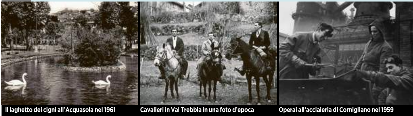
Il laghetto dei cigni all'Acquasola nel 1961