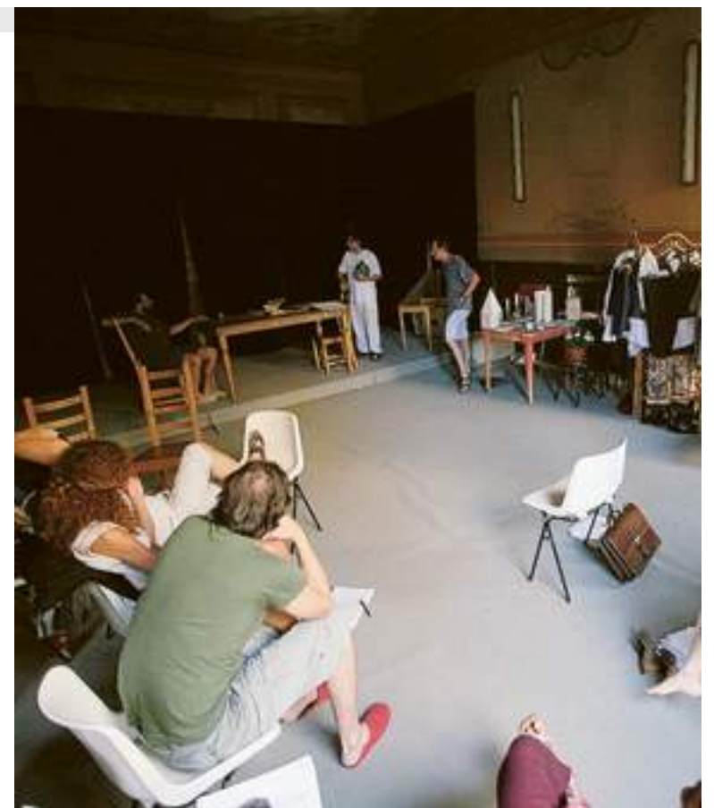
Il Teatro del Banchoero è una delle realtà più attive sul territorio